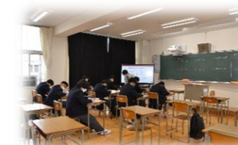
国語・数学・英語